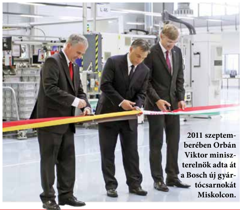
2011 szeptemberében Orbán Viktor miniszterelnök adta át a Bosch új gyártósarnokát Miskolcon.

A Bosch miskolci autóiipari gyára 2011-ben indította gyakorlati képzési programját és tanműhelyét, ám akkor csak 200 négyzetméteres hely állt rendelkezésükre. Ez egy 12 fő befogadására alkalmas elektronikai és egy gépészeti tanműhely kialakítását tette lehetővé. A növekvő tanulói létszám miatt azonban nagyobb, csaknem 900 négyzetméteres lesz az oktatási helyszín.