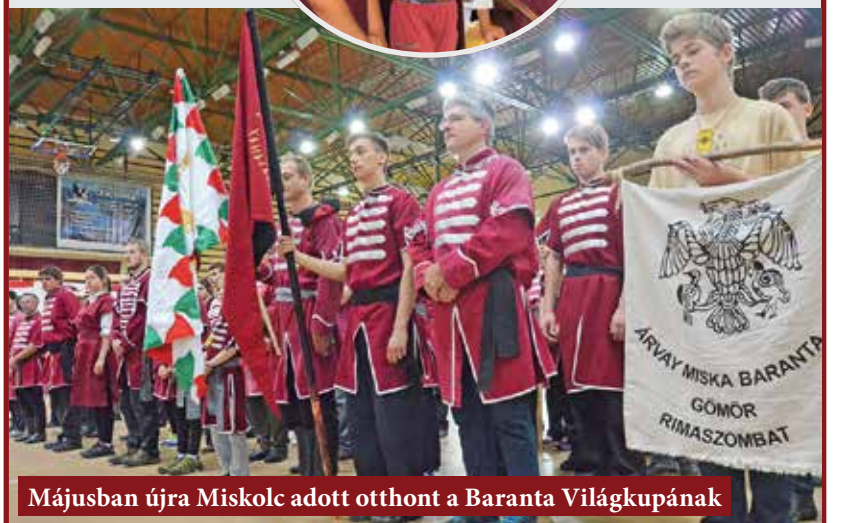
Májusban újra Miskolc adott otthont a Baranta Világkupanak