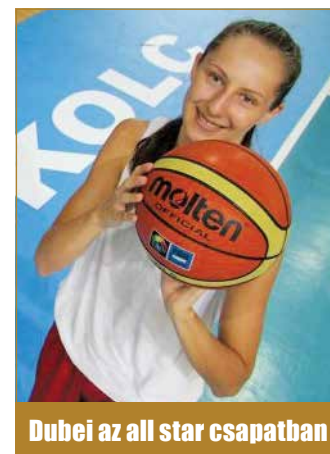
Dubei az all star csapatban

A magyarok veretlenül nyerték meg csoportjukat, majd a tizenhat és a nyolc közé jutá-