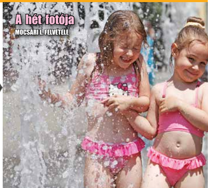
A hét fotója MOCSÁRI L. FELVÉTELE