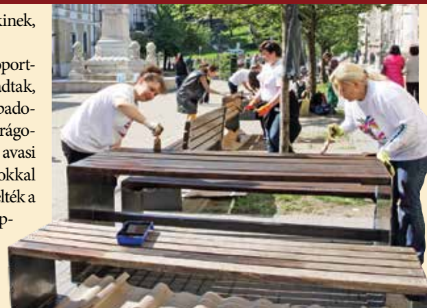
K. L.

Az akcióban résztvevőket három csoportra osztották: akik az Erzsébet téren maradtak, azok az ott található utcabútorokat – a padokat, asztalokat – festették le, valamint virágokat – petúniát és borostyánt – ültettek. Az avasi templom környékén pedig szintén virágokkal tették még szebbé a környezetet, de lecserelték a padokat, és összeszedték a szemetet is a Papszer utcai térfelügyeleti központ mögötti területen.