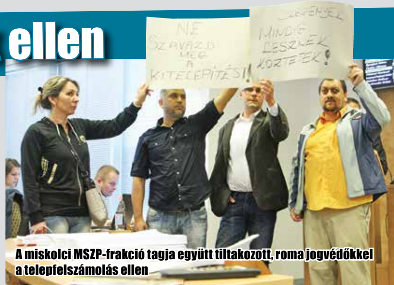
A miskolci MSZP-frakció tagja együtt tiltakozott, roma jogvédőkkel a telep-felszámolás ellen

Kiemelte, a Fidesz – KDNP képviselőcsoport és a városvezetés továbbra is eltökélt szándékában és a tegnapi közgyűlési vita is megerősítette őket abban, hogy jó úton