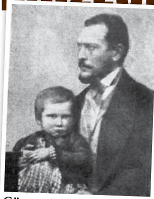
Görgey Artúr civil ábrázolása az 1850-es években, egy dagerrotíp felvételen

A 13. Görgey honvéd gyalogezred gondozta az elődeire emlékeket, így a kassai 9-esek emléktáblája a hadimúzeumba került, a 10-es honvédekre a Zsolcai kapui Rudolf laktanya előtt szobor, a Tizeshonvéd utcai laktanyában emlék-