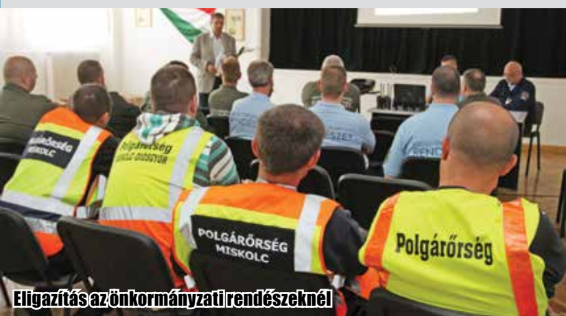
Eligazítás az önkormányzati rendészeknél