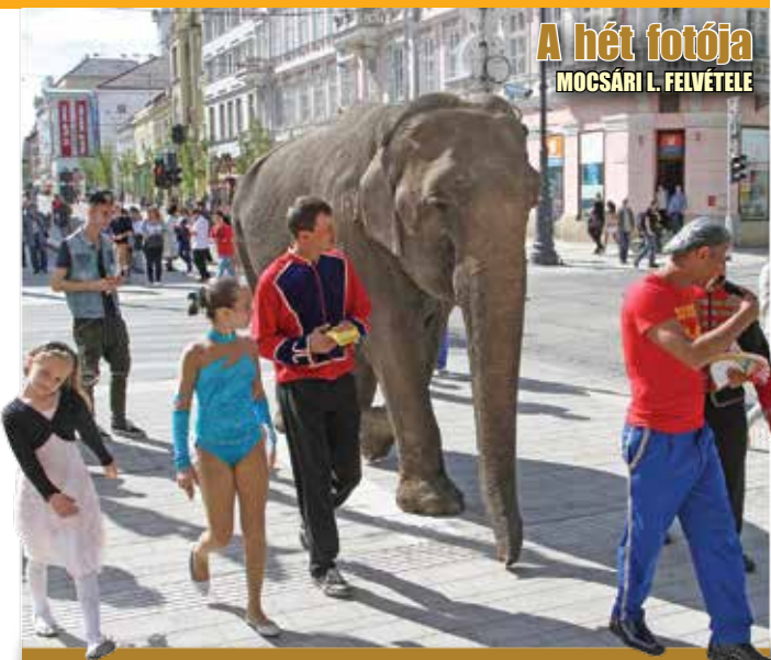
A hét fotója MOCSÁRI L. FELVÉTELE

Kettőt is megrongáltak azok közül az üllőkövek közül, amelyeket a múlt héten helyeztek ki a sétálóutcára. A közfelháborodást kiváltó rongálások a Pátria melletti területen történtek, május 1-jén és 3-án éjszaka. A kihelyezett térfigyelő kameráknak köszönhetően, több felvétel is van az elkövetőkről, ezeket a megyei rendőr-főkapitányság és a Miskolci Önkormányzati Rendészet munkatársai elemzik. A rongálások miatt egyelőre az épen maradt üllőköveket is elszállították. A tervek szerint a megrongált utcabútorokat hamarosan pótolják, s egy másik, biztosabb módszerrel rögzítve, ismét kirakják a sétálóutcára az üllőköveket. A rendőrség vizsgálja, hogy rongálás vagy garázdaság – esetleg mindkettő – valósult-e meg, ez az adatgyűjtés során dől el. Jelenleg folyik a kamerafelvételek elemzése, és szemtanúkat is keresnek.