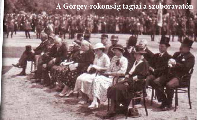
A Görgey-rokonság tagjai a szoboravatón

tábla hívta fel a figyelmet. A 34-esekre a Szikszóra vezető országút mellett Borsod és Abaúj határán Turul emlékmű, míg a 65-ösökre emlékszóbor emlékeztetett. (Ez ma a Hősök temetőjében található.)