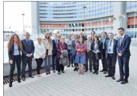
WP7-es munkacsomag konferencia 2013. október

Az uniós támogatású projekt keretében három, határon átnyúló, úgynevezett intermodális közlekedési útvonalat jelöltek ki és fejlesztenek az Észak-magyarországi és a Kassai régióban, a helyben található turisztikai desztinációk környezetbarát módon történő megközelítése érdekében.