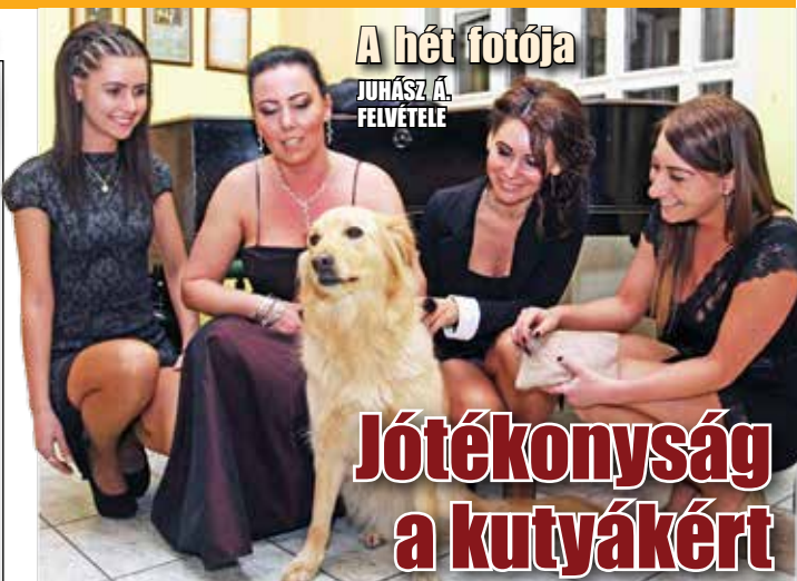
A hét fotója JUHÁSZ Á. FELVÉTELE