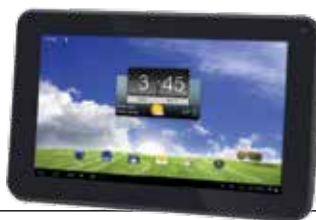
COMPUTER PONT Computer Pont Informatikai Kft. SZÁMÍTÓGÉP SZERVIZ, VIRUSMENTESÍTÉS

Új, négyrészes rejtélyünkben a Becherovka Miskolci Kocsonya Farsang Nonprofit Kft. címére: 3525 Miskolc, Kis-Hunyad u. 9. vagy e-mailben az info@mikom.hu címre. A helyes megfejtések között egy 7 collos, DPS márkájú tablettet sorsolunk ki a Computer Pont Informatikai Kft. felajánlásából.