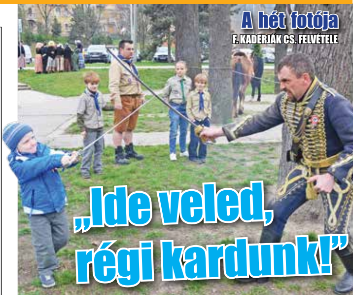
A hét fotója F. KADERJÁK CS. FELVÉTELE