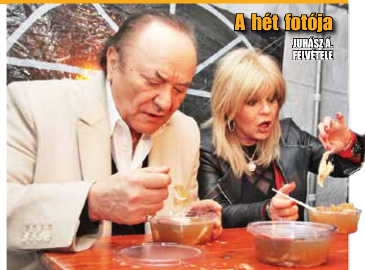
A hét fotója