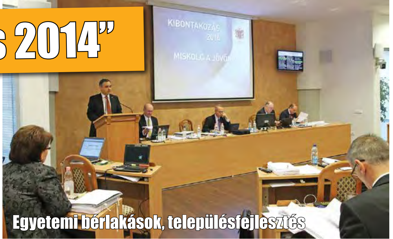
Egyetemi bérlakások, településfejlesztés

A közgyűlés döntött emellett többek között a Diósgyőri Stadionrekonstrukciós Korlátolt Felelősségű Társaság alapításáról, elfogadta a Településfejlesztési Konceptiót, a belváros tehermentesítését célzó közúti fejlesztések előkészítésére készült tanulmányt, valamint a városi és elővárosi kötőpályás közösségi közlekedési rendszerek fejlesztéséhez készült előkészítő tanulmányt is.