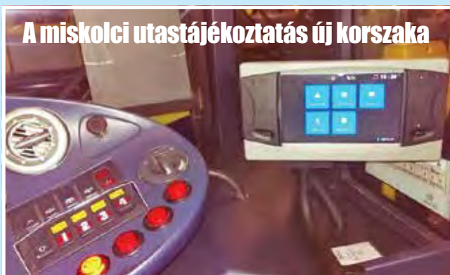
A miskolci utastájékoztató új korszaka

– ezzel megvalósul a valós idejű utastájékoztató – hangsúlyozza a közlekedési vállalat közleménye, mely szerint az MVK Zrt. sikeresen tesztelte az utastájékoztatói és forgalomirányítási rendszer próba-verzióját. A próbaüzem során beüzemelték és tesztelték a forgalmi tervező és irányítási, valamint az új diszpécseri rendszert. Felszerelték és tesztelték két Neoplan típusú autóbusszon a fedélzeti számítógépet is (képünkön), amely méter-