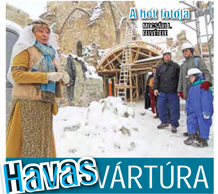
A hét fotója