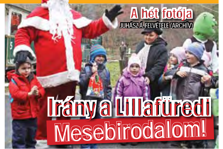
A hét fotója JUHÁSZÁ, FELVÉTELE (ARCHÍV)