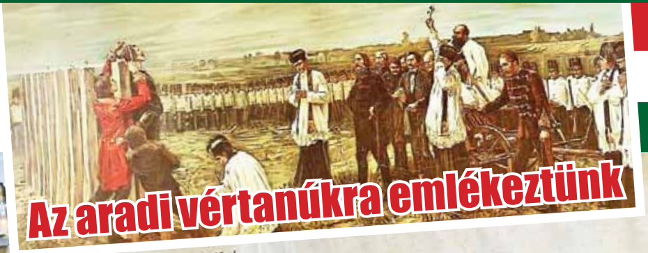
Az aradi vértanúkra emlékeztünk