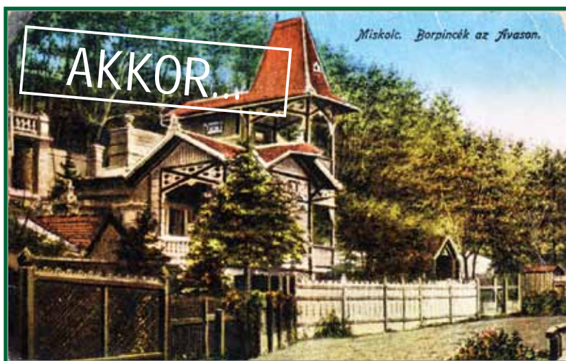
Miskolc. Borpincék az Ávason.