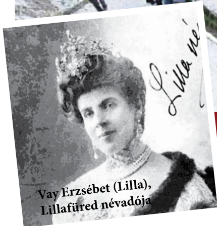
Vay Erzsébet (Lilla), Lillafüred névadója

Ünnepélyes keretek között átadták szombat délután a mintegy 265 millió forintból, a Diósgyőr-Lillafüred komplex kulturális és ökoturisztikai fejlesztés részeként megújult lillafüredi függőkertet. Az ünnepi köszöntőket követően a szobrászat teraszán felavatták Herman Ottó szobrát is, majd a teraszok tematikájának megfelelően koncertek, felolvasások, játszóház, este pedig fényfestés várta a látogatókat.