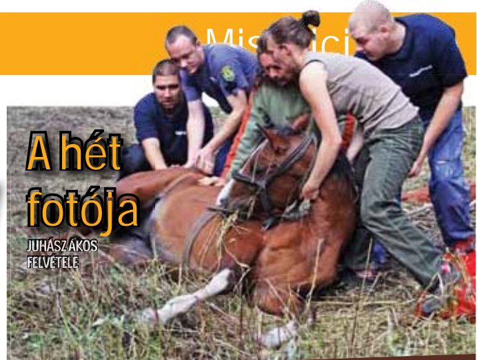
A hét fotója