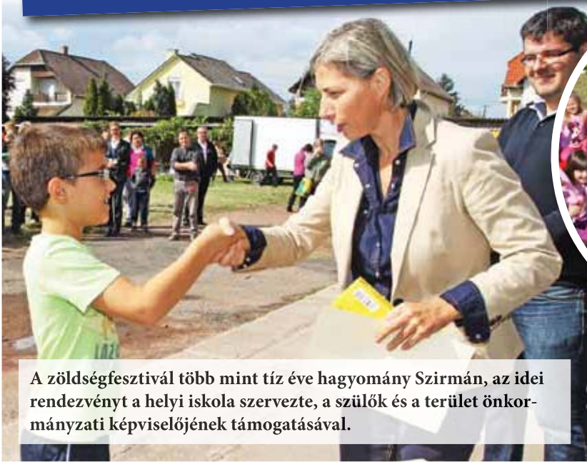
A zöldségfesztivál több mint tíz éve hagyomány Szirmán, az idei rendezvényt a helyi iskola szervezte, a szülők és a terület önkormányzati képviselőjének támogatásával.