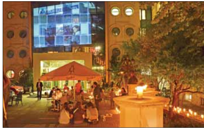
Az évadzáró Táncünnep után máris évadnyitó pikniket tartottak

– Minden statisztikát, eddigi látogatottságot magasan túlszárnyaltunk. Tavaly 107 705 jegyet, bér-