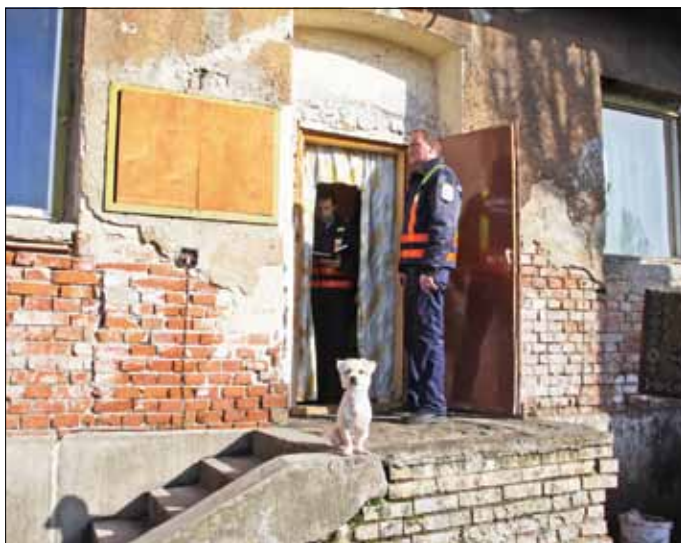
Képünk egy korábbi, Álmos utcai ellenőrzésen készült

A MIK Miskolci Ingatlan-gazdálkodó Zrt. ütemezetten végzi az avult telepek felszámolását. Távaly sikerült rendezni a Búza tér 4., a Szendrei u. 1., a Dráva u. 1. és a Szentpéteri kapu 3. szám alatti ingatlanok önkormányzati lakásainak helyzetét.