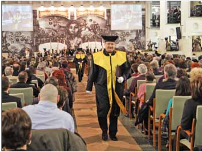
Diplomaátadó a Miskolci Egyetemen. Szeretnék az itt végzetteket Miskolcon tartani, és a miskolci középiskolásokat gólyaként köszönteni

A Miskolci Egyetem meghatározó intézménye a hazai felsőoktatásnak, célja, hogy a térség és az ország számára értékes szakembereket képezzen. Ahogyan az is, hogy helyben tartsa a fiatalokat.