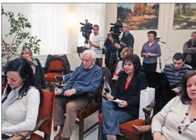
Nagy sajtóérdeklődés övezte a polgármester bejelentését

– A projekt alap gondolatát Miskolc város közgyűlése azzal a felté-