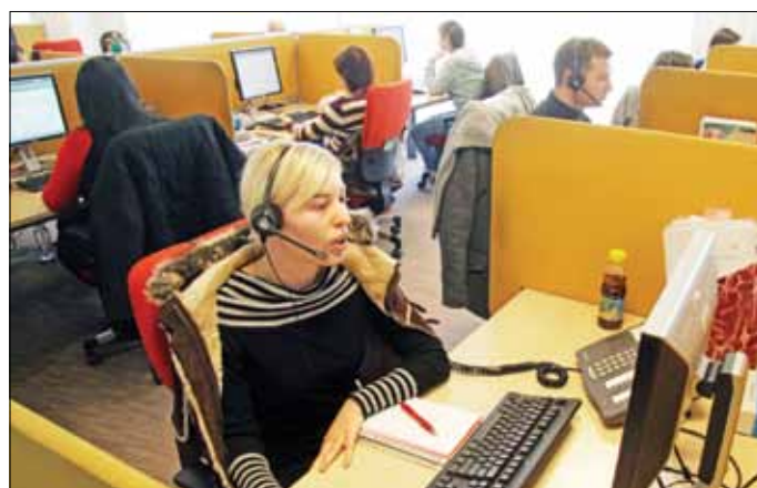
A Vodafone call center megnyitásával is közreműködött a HITA

– Közreműködtünk a miskolci Vodafone call center megnyitásával, a Konecranes finn emelőtechnikai cég idetelepítésében,