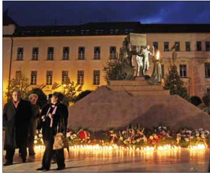
56 hőseire emlékezünk: október 20., 21., 23.

14.00 | Teátrum tv. Ismeretterjesztő előadással egybekötött színházi közvetítések, miskolci színművészek készített riportfilmek. Színház történeti és Színészmúzeum. 17.00 | Az együttélés értékei. Művészeti Szabadegyetem. Miskolci Galéria, Feledey-ház.