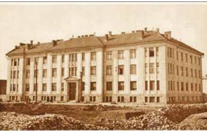
M. kir. állami fa- és fémipari szakiskola Miskolc, Soltész Nagy Kálmán-utca

77 éve, 1935. július 11-én jelent meg a Felsőmagyarországi Reggeli Hírlap első száma. Elődjé 1902-től az Ellenzék, 1913-tól a Miskolczi Estilap, 1918-tól a Reggeli Hírlap volt. A napilapot 1944. április 16-án betiltották.