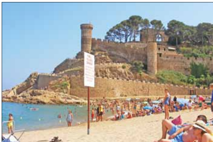
Fontos, hogy utazás előtt tájékozódjunk, „ellenőrizzük” a desztinációt

– Az első minden esetben annak a kiderítése, utlevél vagy személyi igazolvány szükséges-e az adott országba való belépéshez, de az autós és buszos utazásnál arra is oda kell figyelni, hogy mely államokat érintjük, míg eljutunk célországunkhoz. Nem győzzük hangsúlyozni a biztosítás fontosságát: nem elég az Európai Egészségbiztosítási Kártya sem, mert csak bizonyos alapellátásokat fedez. Azt tanácsoljuk, ne ezen spóroljanak az utazók,