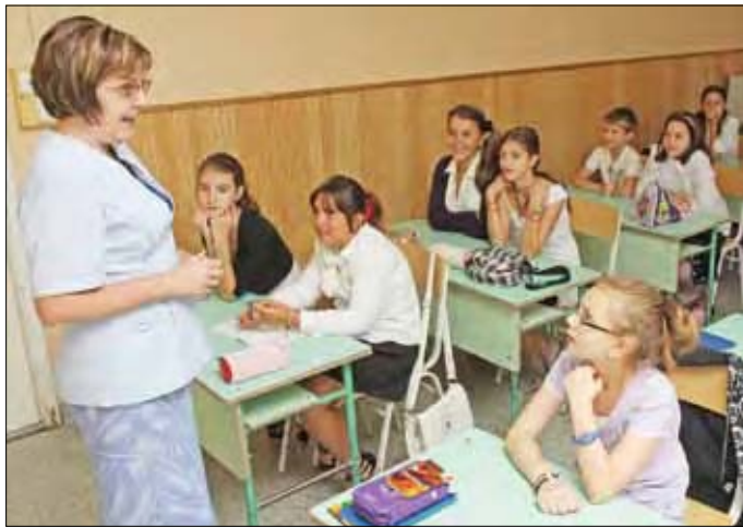
A prioritások között szerepel a színvonalas közoktatás feltételeinek megteremtése is

Az önkormányzat csütörtöki ülésén a költségvetési koncepció megvitatásával megteszi az első lépést a város jövő évi pénzügyi kereteinek meghatározásához. Az elfogadott koncepció alapján következhet a részletek pontosítása, kidolgozása, majd – várhatóan márciusban – a 2012. évi költségvetésről szóló rendelet megalkotása.