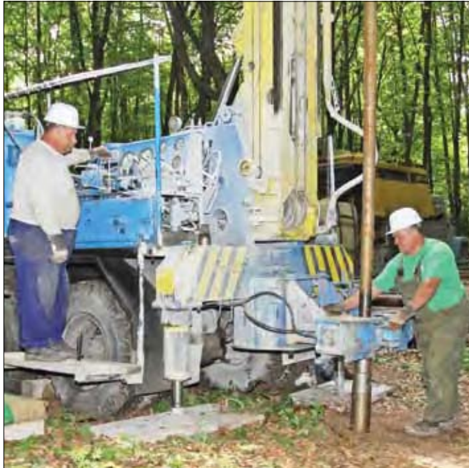
Észlelőkút-fúrás a Bükkben: a vízdíjban szükség van a fejlesztési hányad beépítésére, például a vízbázis védelmét szolgáló fejlesztések önrészeire

Áremelésre kényszerül az MVK Zrt., az üzemanyagárak drasztikus emelkedése, a megemelkedett alkatrészárak és ezzel együtt a karbantartás költségeinek növekedése miatt. Az állam által adott árkiegészítés, amely a helyi közlekedésben a tanulók és a nyugdíjasok kedvezményes bérletét támogatja, évek óta nem fedezi a különbözetet a teljes árú bérletekhez képest. Az MVK Zrt. több tervet készített, nettó értékben 4,4%, 6,3% és 8,3%-os áremelést javasolva. A gazdálkodási egyensúly megtartása érdekében a társaságnak a bevételek növelésén túl az utasszám-csökkenést is figyelembe véve, ésszerű járatszámtervezéssel is kell a költségeket csökkentenie 2012-ben.