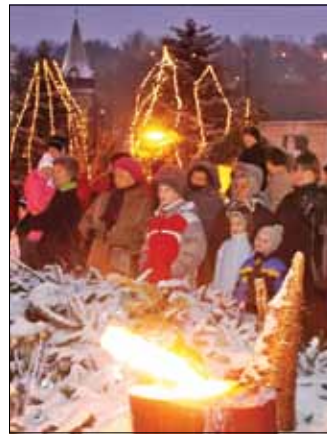
November 27., vasárnap – adventi gyertyagyújtás

09.00 | Adventi családi délelőtt. Petőfi Könyvtár. 09.00 | Adventi virágkötészet. József Attila Könyvtár. 09.30 | 2012 és a jelenkor változásai. Spirituális konferencia. Földes Ferenc Gimnázium. 11.00 | Virágzó népművészet. Díjtadó és kiállítás-megnyitó. Diósgyőri Kézműves Alkotóház. 16.00 | Adventi kézműves délután. Nyilas Misi Ház. 18.00 | La Mancha lovagja. A Romano Teatro előadása. Romano Teatro próbahelyisége.