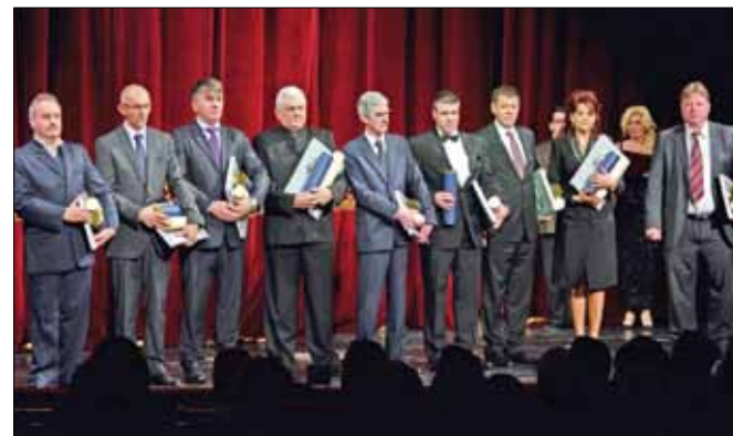
Az Év Vállalkozója Borsod-Abaúj-Zemplén Megyében Díj kitiütetettjei

A gálaesten kiosztották az Év Vállalkozója Borsod-Abaúj-Zemplén megyében címeket is, mellyel olyanokat ismertek el, akik vállalkozásukban maradandót alkottak a térségben.