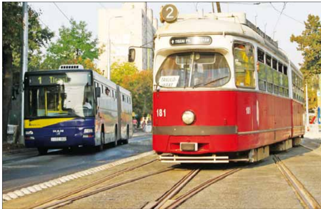
A próbajáratok már csütörtöktől járnak a megújult pályákon | fotó: Mocsári L.

– A diósgyőri pályáépítés befejeztével, előreláthatólag november