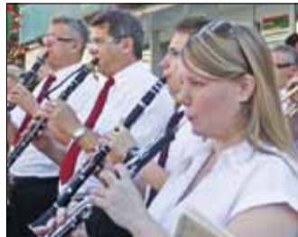
Az ünnep reggelén a belvárosban, az Avason és Diósgyőrben is a Bányász-fúvószenekar ébresztette a miskolciakat.