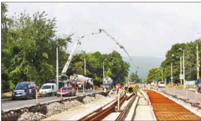
Már épül a betétvégállomás a Kiliánban

A villamosprojekt kezdete előtt évtizedek óta csak két jelzéssel járt villamos Miskolcon: az 1-es a Tiszai pályaudvar és Diósgyőr között, a 2-es pedig – az előző betétjárataként – a pályaudvar és a Vasgyár között. – Ha elkészül a pálya, és az új villamosok is megérkeznek, ez megváltozik, elindul az 1A-s villamos is, ez