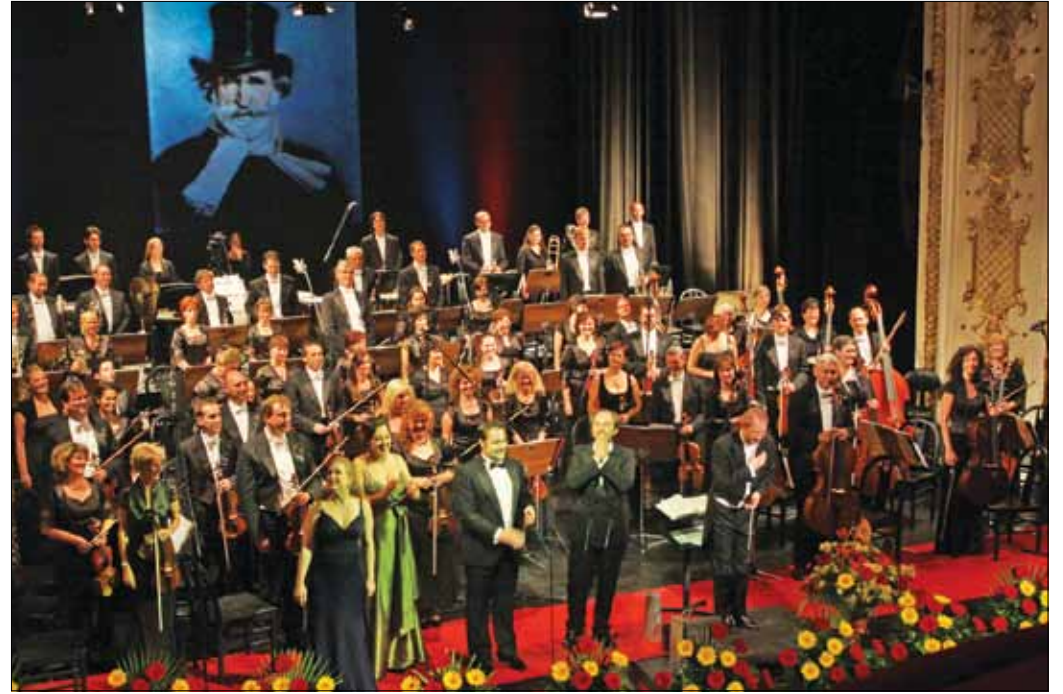
A fesztivál Verdi-gálával búcsúzott – a közönség ovációval