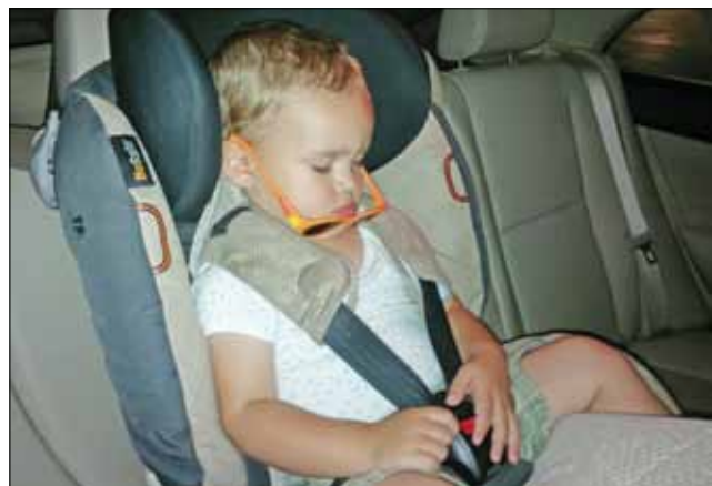
...Levi baba is ezt ajánlja: BeSafe iZi Comfort X3

A gyártó három fontos szempontot – biztonság, kényelem és kezelhetőség – olyan összhangban teremtett meg, amely kategóriájában egyedülálló.