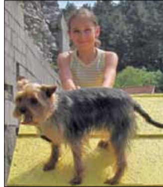
Diósgyőri kutyamustra – május 14.