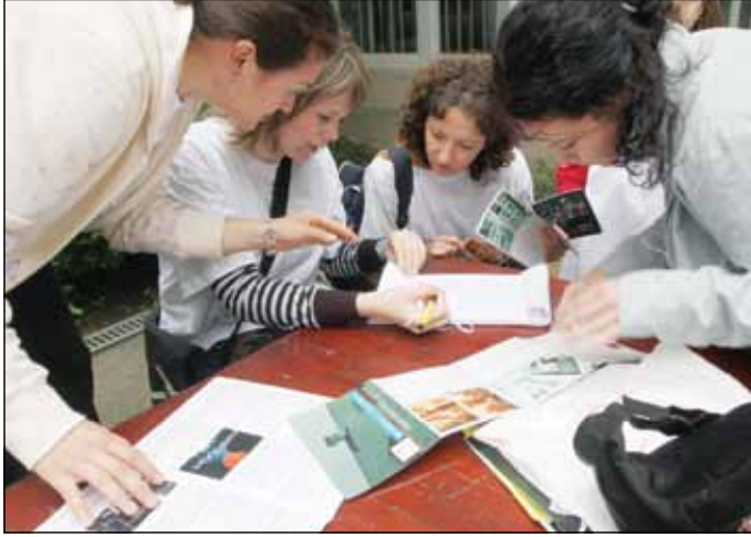
Játékos Városjárás – május 14., szombat. A játékosok aznap ingyen utazhatnak