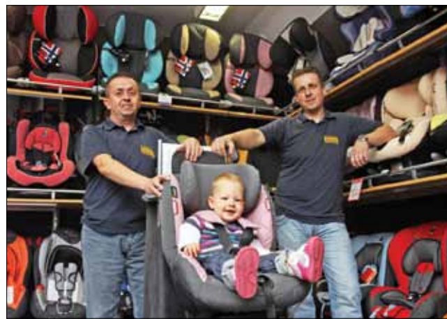
Hivatásunk: a gyermekek életének megóvása

Hogyan vásároljunk gyermekülést, hogy biztonságban tudjuk gyermekünket?