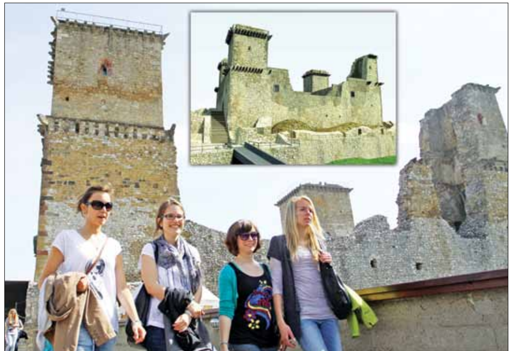
A látványterven (kis kép) látszik a jövő – de addig még jelen valójában mutatja magát a diósgyőri vár