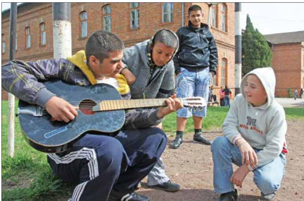
A baptista egyház „közösségi ház” szerepét betöltő funkciókkal is bővítendő a Fazola tevékenységét | fotó: Mocsári L.

A közgyűlés jóváhagyása esetén az iskolákat körzettel, közoktatási feladatokkal együtt adják át az egyházaknak, tehát azokat a gyerekeket, akik az érintett körzetekben élnek, s ide kívánnak jelentkezni, továbbra is fel kell majd venni. Ugyanígy azokat a pedagógusokat, akik jelenleg ezekben az iskolákban dolgoznak, s a továbbiakban is maradni szeretnének, az intézmények egyházi tulajdonba kerülése esetén is tovább foglalkoztatják majd.