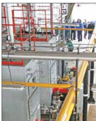
A Futó utcai fűtőmű két éve működik

terézetigazgatója érdeklődésünkre elmondta, a Bogáncs utcai egykori személtérlepen több mint száz kutatófürtök a biogáz kinyerésére, ezek azonban nem egyenletes hatásokon működnek, és a metántartalom is nagyon változó a kinyert gázban. Ezért kezdték el a kutak felmérését, remé-