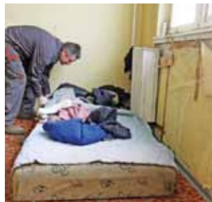
Éz maradt a kiköltözők után