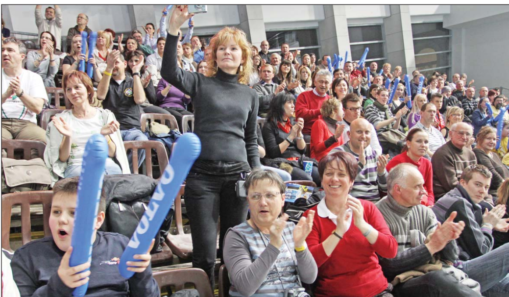
A közönség rendre megtöltötte a lelátókat a magyar válogatott mérkőzése alatt