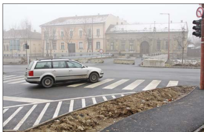
A Malomszög utca végén lévő híd kettő helyett egy irányú lesz