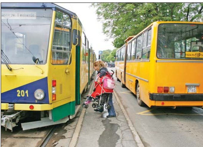
A Thököly utca, ahogy tavaly, az idén is fontos átszállóhely

A fórumon résztvevő közlekedési és kivitelező szakemberek szorgalmasan jegyzeteltek: a legtöbb témában további egyeztetésekre van szükség.