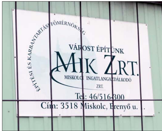
Mindhárom, folyamatban lévő büntetőügyben érintett a MIK Zrt.

A Bodótető fejlesztésére alakult MBF Hills Kft. tagi kölcsönrel indult, melyből 60 millió forintot a MIK Zrt. készpénzben megfizetett. 170 millió forintot a tulajdonostárs adott, de azt – különféle szolgáltatások nyújtásával – ki is vette a cégből. A projekt kezdetén két telket adott el az önkormányzat. A rögzített opciós vételár a piaci érték 60 százaléka volt. A közművesítésért már fizetett az önkormányzat előleget, holott egy kapavágás sem történt, sőt, hiányoz-