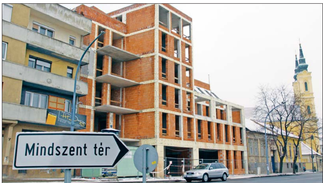
Három ügyben már nyomoznak – az egyik a Görgey-ház, az „ország legdrágább lakóháza”