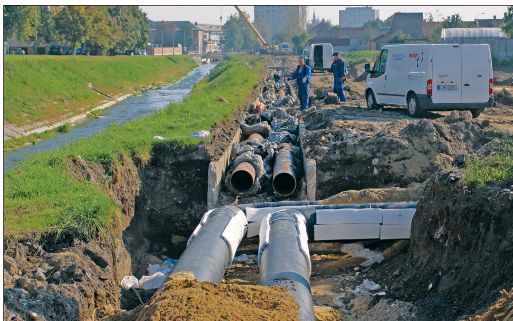
A Petőfi utcai rekonstrukciónál a körösítő vezetékrendszer segít

Ez a körösítő vezetékrendszer tette lehetővé idén nyáron a