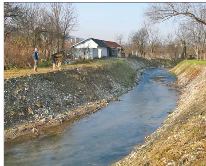
A Szinva mederszelvényeit Diósgyőrben már több helyen kikottarták és helyreállították.

A májusban és júniusban bekövetkezett árvizek és egyéb elöntések főként a város nyugati területén okoztak jelentős káreseményeket: Alsó- és Felsőháromban, Lillafüreden, Majláth, Diósgyőr, Bükkzentlászó és Perces városrészekben. Az utakban-hidakban, önkormányzati intézményekben, vízi létesítményekben és partfalakban keletkezett károk összege eléri az 1,53 milliárd forintot. – A károk helyreállítására, a védekezési költségek elszámolására 17 vis maior-pályázatot nyújtottunk be a Belügyminisztériumhoz. Ezek közül 13 részesült támogatásban, négy pedig még elbírálás alatt van. Az igényelt, 1,53 milliárdból eddig 736 millió forint összegben kapott támogatást az önkormányzat – tájékoztatt