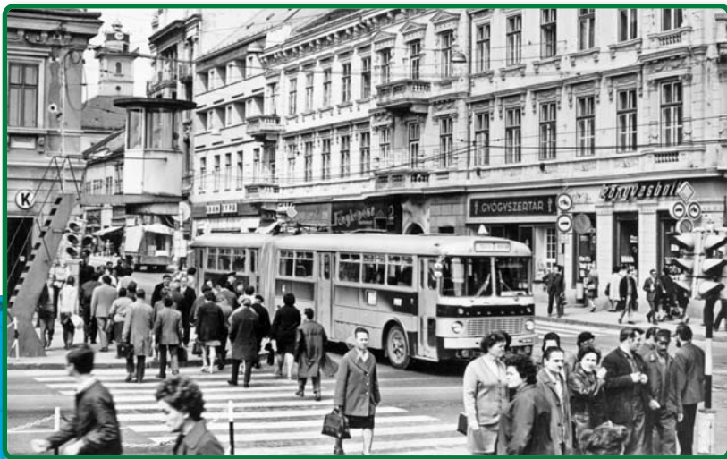
A felújított Villanyrendőr