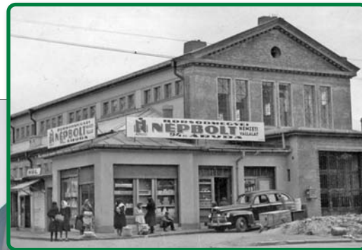
A Búza téri piac megújult vásárcsarnoka