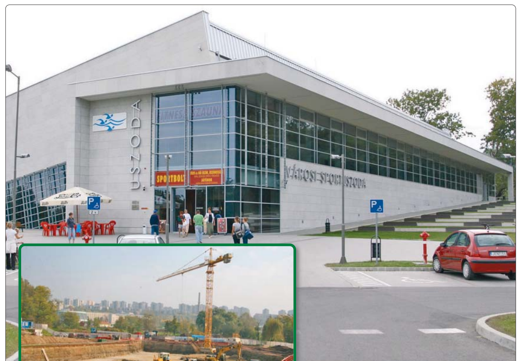
A Dr. Kemény Dénes Miskolc Városi Sportuszoda