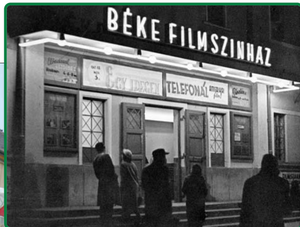
A Béke mozi helyén épült Művészetek Háza