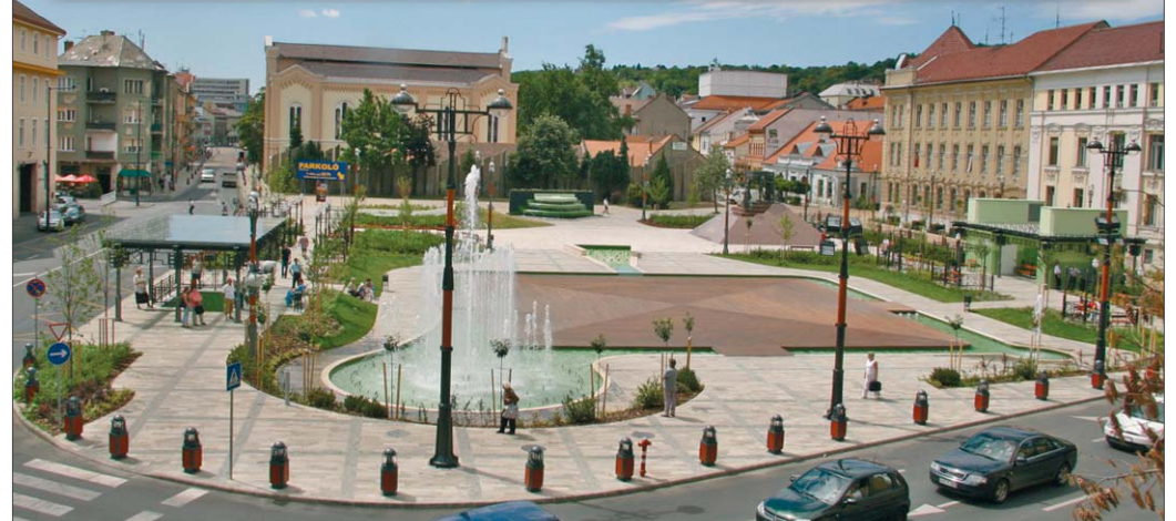
A teljesen megújult Hősök tere