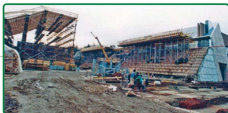
A Miskolc Városi Jégcsarnok