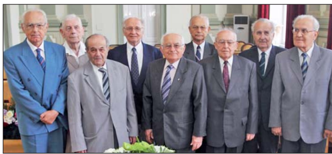
Kilenc professzort köszöntöttek pénteken.

A pénteki ünnepségen a Miskolci Egyetem Bölcsészettudományi, Gépezeműmőki és Informatikai, Műsza-