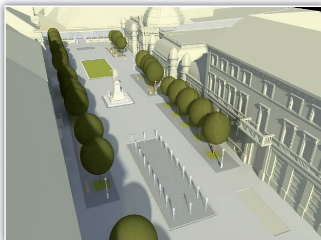
A projekt az Európai Unió támogatásával, az Európai Regionális Fejlesztési Alap társfinanszírozásával valósul meg.