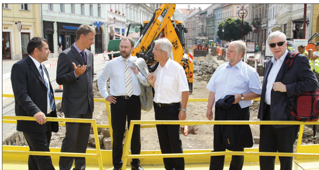
A küldöttséget a holding igazgatója és az önkormányzati cégek vezetői kalauzolták.

Több adománygyűjtés is indult Aschaffenburgban, amikor meghallották, hogy Miskolcon és környékén pusztított az ár – hangzott el a városháza ovális termében tartott tájékoztatón. Túl ezeken, a német város önkormányzata, valamint a városüzemeltetésért felelős szervezet 18-18 olyan gépet vásárolt, és adományozott Miskolcnak, melyek segítségével ki lehet szűrni azokat a házakat, melyekben pusztított a víz. A berendezések beüzemelésében az aschaffenburgi tűzoltóság emberei is segítettek a helyieknek.