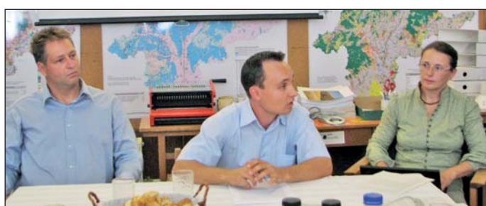
Az egyesület sajtótájékoztatóján beszélt az ítéletről.

A lakosság ekkor Sólyom László köztársasági elnökhöz fordult segítségért, akinek a javaslatára 2007 nyarán megalapították a Sajóvölgye Környezetvédelmi Egyesületet, amely 2008 szeptemberében keresetet indított a BÉM Zrt. ellen. Azt kérték a bíróságtól, tiltsa be a cég működését – a perbe később a Miskolci Városi Ügyészség és a jövő nemzedékek országgyűlési biztosa is bekapcsolódott, az egyesület oldalán. A városi bíróság tavaly, november 9-i, első fokú ítéletében be is tiltotta a BÉM Zrt. környezetszennyező tevékenységét. A vállalat viszont tagadta, hogy olyan tevékenységet végez, mely során bűz keletkezhet, s fellebbezéssel élt az ítélet ellen. A B.-A.-Z. Megyei Bíróság ezt követően, jogerős ítéletében ismét megállapít