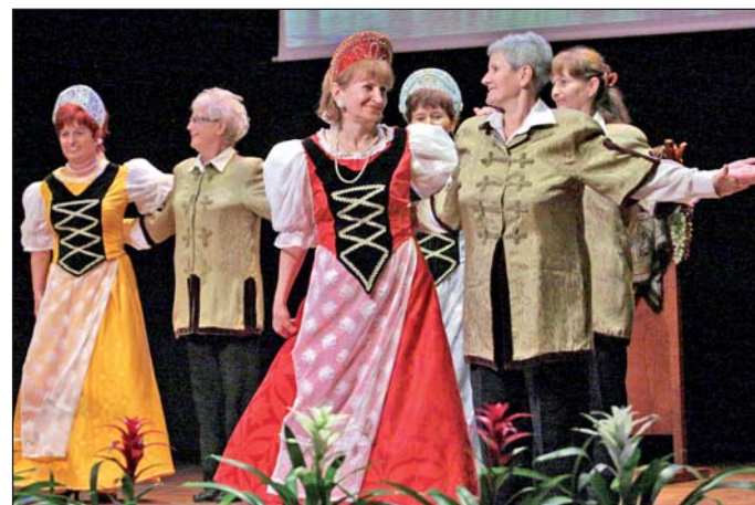
A tavalyi gála egyik fellépőcsoportja.