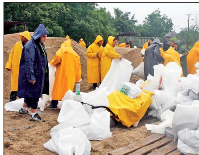
Több ezer homokzsákokat állítottak össze, most elszállítják őket.

Ezek Ómassától Miskolctapolcáig a város szinte minden pontján megtalálhatóak, begyűjtésüket most megkezdte a Városgazda Kft. A cég munkatársai kéri a lakosságot, hogy a 412-611-es miskolci telefonszámon jelentsék be, hol található még magánterületeken homokzsák, melyet egyeztetés után elszállítanak.