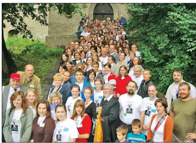
A találkozó résztvevői.

Ennek az eseménysorozatnak is előrendezője volt a találkozó. A nyitó istentiszteleten a sepsiszentgyörgyi küldöttség – a találkozó előző évi szervezői – átadták a találkozó vándor kopfáját. A találkozóra a Kárpát-medence valamennyi magyar református középiskolájából – szám szerint 42-ből – érkeztek küldöttek. 27 ilyen gimnázium működik Magyarországon jelenlegi területén, 9 Erdélyben, 4