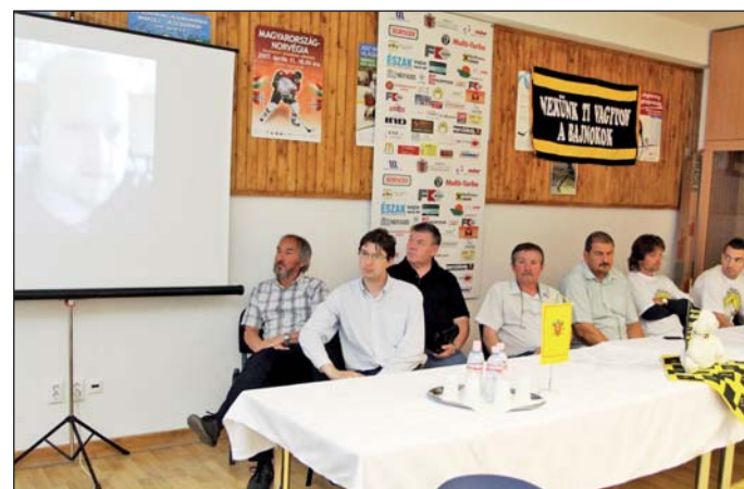
Az új szakvezető webkamerás kapcsolattal vett részt a tájékoztatón.