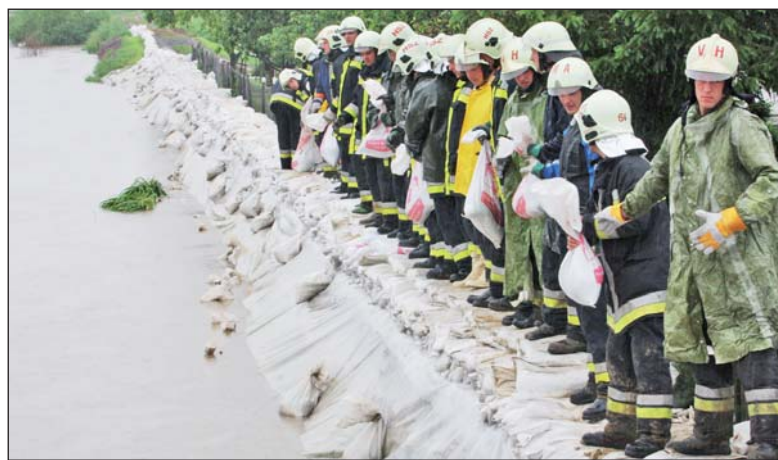
Megfeszített védekezés Ócsánálson.