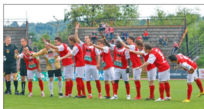
A piros-fehérek búcsút inthetnek az első osztálynak.