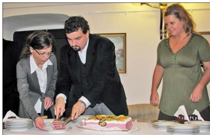
A tizedik születésnaphoz torta is dukált.

vezők le akarták fújni a nyitófelvonulást, a résztvevők azonban úgy gondolták, hogy a tizedik, jubileumi fesztivál nem lenne nélküle teljes, így ingyen vállalták. Elmarad viszont idén a tűzijáték a fesztivál zárásaként.