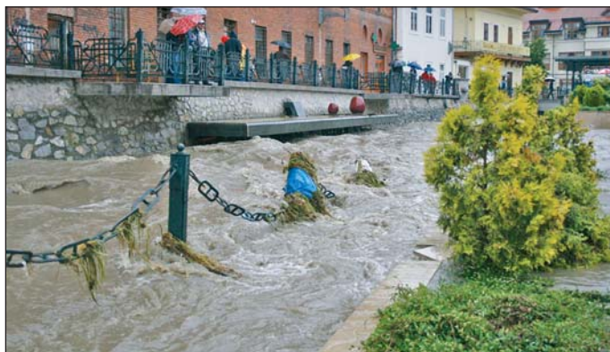
Víz alatt a Szinva terasz.