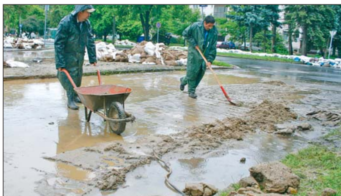
Szerdai takarítás Kiliánban.