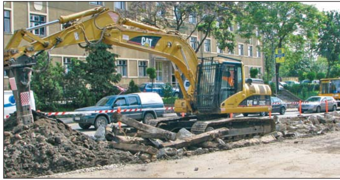
A pályán már dolgoznak, de a járműbeszerzés csúszik.

A döntőbizottság a határozatában megsemmisítette a bíráló bizottság döntését, amely az olasz AnsaldoBreda céget nyilvánította nyertesnek, a spanyol CAF járműgyártót pedig második legjobb ajánlattevőnek. A bizottság érvénytelennek minősítette az említett két ajánlattevő pályázatát. Az olasz cég esetében a szállítási határidő megadásával volt probléma (a járművek szál-