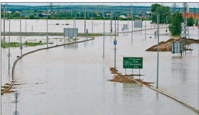
Tengerbe vesző autót Miskolc határában.