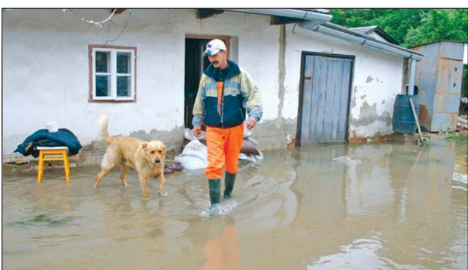
Kedden sok udvarban még mindig a víz volt az úr.