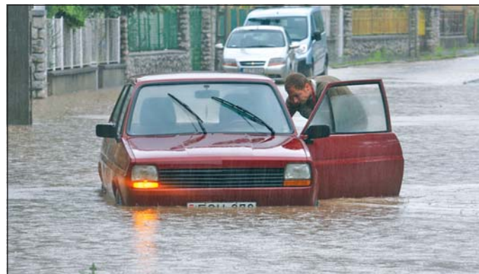
Elakadt autó az ár közepén Bereklján.