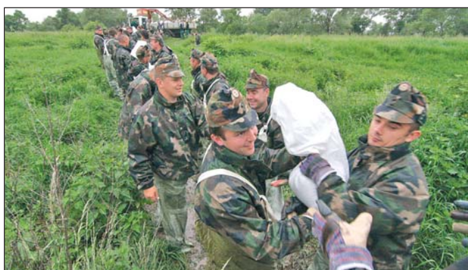
A Sajó utcán hétfőn volt a legnagyobb készlet.