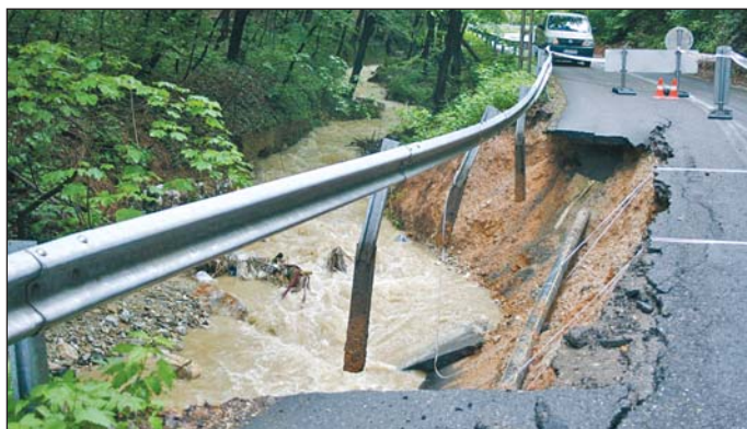
Az úttest alapját is kimosta a Mexikó patak.