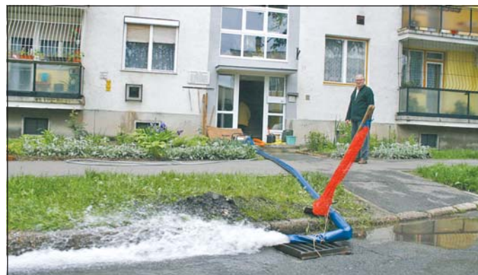
A pincéből szivattyúzzák a vizet a Kandó Kálmán utcán.