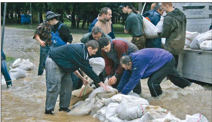
Homokzsákolás a Könyves Kálmán utcán.

Május 16-án, vasárnap özönvízzerű esőzés csapott le Miskolcra, amely a patakok komoly áradását okozta. A hétfő és a keddi nap még a védekezésé volt, míg szerdától megindult a takarítás és a helyreállítás. Fotósaink mindenhol ott voltak, hogy dokumentálják a város harcát a vízzel.