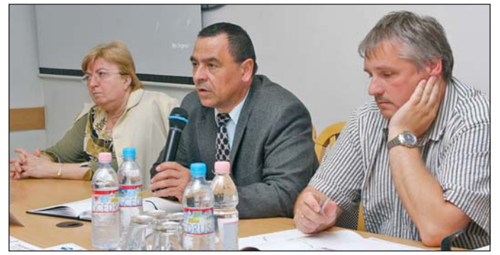
A fórum előadói a kereskedők igényeit és kérdéseit gyűjtötték egybe.

Fórumot szervezett szerda délután a Borsod-Abaúj-Zemplén Megyei Kereskedelmi és Iparkamara, melyen a Zöld Nyíl villamosprojekt kapcsán felmerülő kérdésekre igyekeztek a projektigazgatóság és a kivitelező cég szakemberei válaszolni.