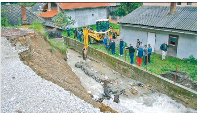
Leszakadt támfal Bükkszentlászlón.

Május 29–30-án várnak reggel 8 órára mindenkit a DVTK-stadion főbejáratához, aki csatlakozni szeretne a sportolókhöz a munkában. A Városgazda Nonprofit Kft. biztosítja az elszállításához, illetve takarításhoz szükséges eszközöket, felszereléseket.