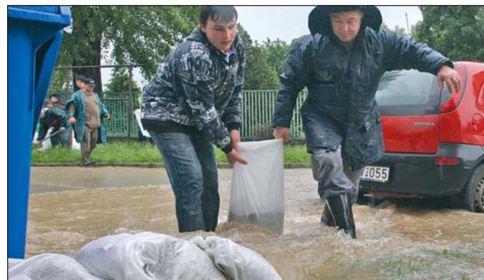
Majláthón a panelben élőknek is védekezni kellett.