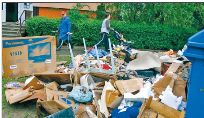
Panelpincében elázott értékek a szeméten.

kiürített homok közvetlenül nem használható fel. A homokot csak a kijelölt helyen lehet összegyűjteni, és csak teljes kiszáradás után használható fel építkezéshez. A kiszáritott homokzsákok pedig kizárólag hulladékok, építési törmelék gyűjtésére alkalmazhatók. A tájékoztató rámutat: játszótérekhez és homokozókhoz semmilyen – az árvízvédelemben már alkalmazott – homokot nem szabad felhasználni, és akár érintkezett a zsákkal a víz, akár nem, abban tilos élelmiszert gyűjteni vagy tárolni – áll az ÁNTSZ tájékoztatójában.