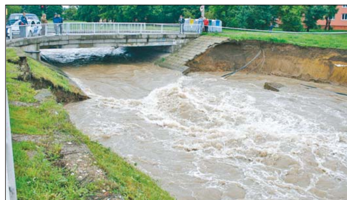
A Szinva is vitte a partfalat a Kiss Ernő utcán.