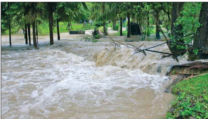
Hömpölygő áradat Hámorban.