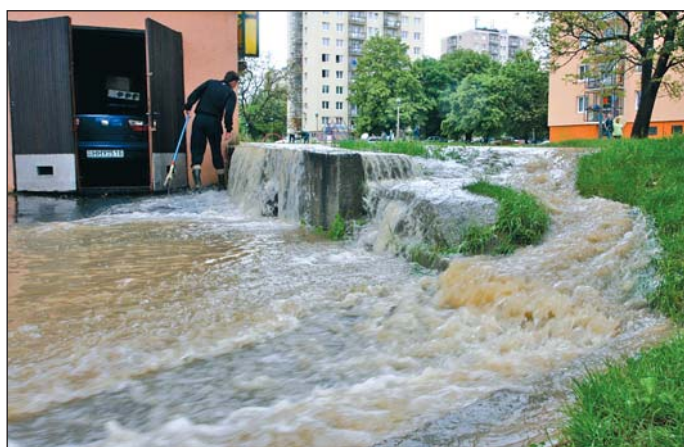
Az árvízzel kapcsolatos tapasztalatok alapján intézkedési terv született.

A napirendi pont tárgyalásához nagyon sokan hozzászóltak –