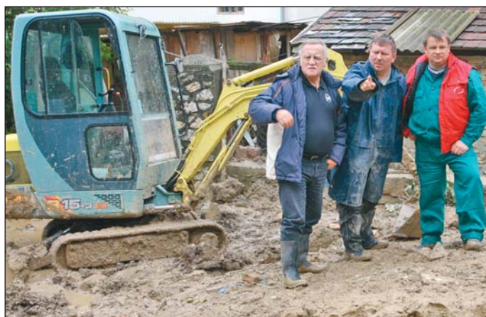
Itt vasárnap reggel még nyárikonyha állt.

A legnagyobb problémája az utcán megkérdőzött embereknek, hogy akadozott a tömegközlekedés, így nem volt egyszerű bejutni a városba, illetve onnan haza. Gyakorlatilag egy mikrobusz járt csupán a hét közepén, amely egyszerre tíz embert tudott szállítani. Ennek az okát hamar felfedezték Bükkszentlászló felé autózva, az utat ugyanis több helyen úgy alámosta az egyébként nagyon szelíd patak, hogy vagy omlásveszélyes, vagy le is szakadt. Hat-hét helyen is szalagokkal van elkerítve a veszélyes rész, van, ahol kötelekkel kötötték meg a szabadba