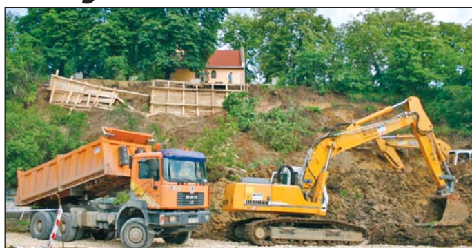
Pénteken már munkagépek dolgoztak a támfal megerősítésén.

Kedd délelőtt kint jártak a temetőben az ÁNTSZ szakemberei, és felfüggesztették a koporsós temetést, így meghatározatlan ideig csak urnás búcsúztatásra van lehetőség. Ugyanakkor döntés született arról is, hogy a veszélybe ke-