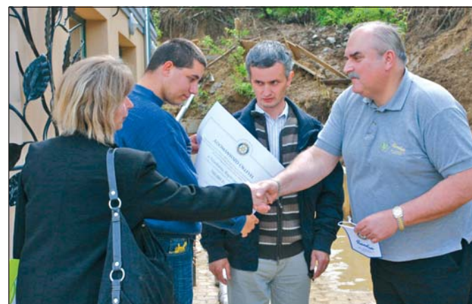
A Szimbiózis majorságában már át is adták az adományt.

A Rotary Klub Miskolc szervezete is segíteni szeretne az árvíz miatt bajbajutottakon, ezért gyűjtést indítottak.