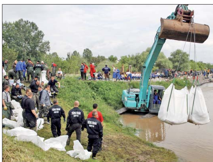
Csütörtök délutáni helyzetkép Edelényben.

A legkritikusabb helyzet Edelényben volt, ahol még csütörtök