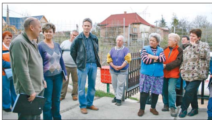
A bejáráson a képviselő egyeztetett a lakókkal.

A területen és környékén 2009 őszén építették ki a régóta várt szennyvízcsatornát, amely 61 lakás szennyvizének elvezetéséről gondoskodhat. A beruházás 100 millió forintot meghaladó költségének több mint 80%-át az önkormányzat állta, a háztartások pedig, anyagi erejük függvényében folyamatosan kapcsolódnak rá a szennyvízelvezetőre. Az itt élők természetesen örülnek a csatorna kiépítésének, amire nagy szükség volt már, az utak helyreállításával kapcsolatban azonban vannak problémáik. Kifogásolják az aknatekők kiépítésének állapotát, de egyes he-