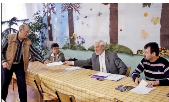
Az ülésen fejlesztésekről is döntöttek.

Megalakult az Észak Kilián Településszerű Önkormányzat, fő feladata a városrész helyzetének, infrastruktúrájának javítása és a közbiztonság erősítése.