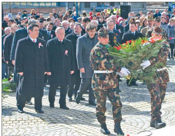
Az ünnepség a Petőfi téri koszorúzással zárult.