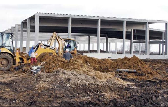
A Hell épülő üzemcsarnoka az ipari parkban.

A másik nagy befektetés a magyar és nemzetközi jogvédelem alatt álló kavitációs kazán. A kavitációs kazán a folyadékból kiváló gőzbuborékok keltését, kezelését és kellő időben történő szétbontását végzi. Az előidézett kavitációs hatás révén nagy mennyiségű hőenergia szabadul fel, amit hasznosítanak. Ezzel a technológiával,