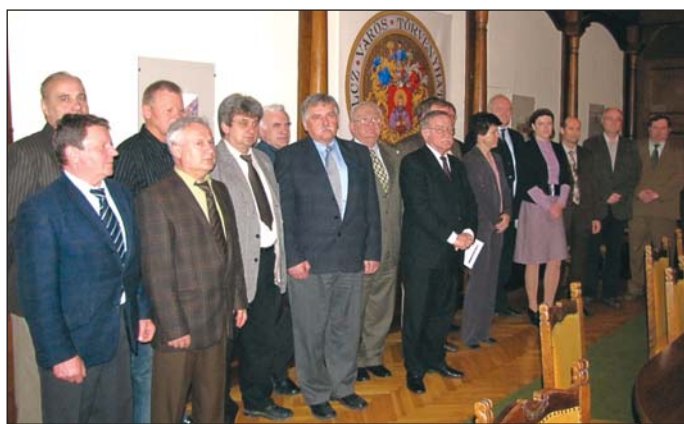
A klaszter tagjai az aláírás után.