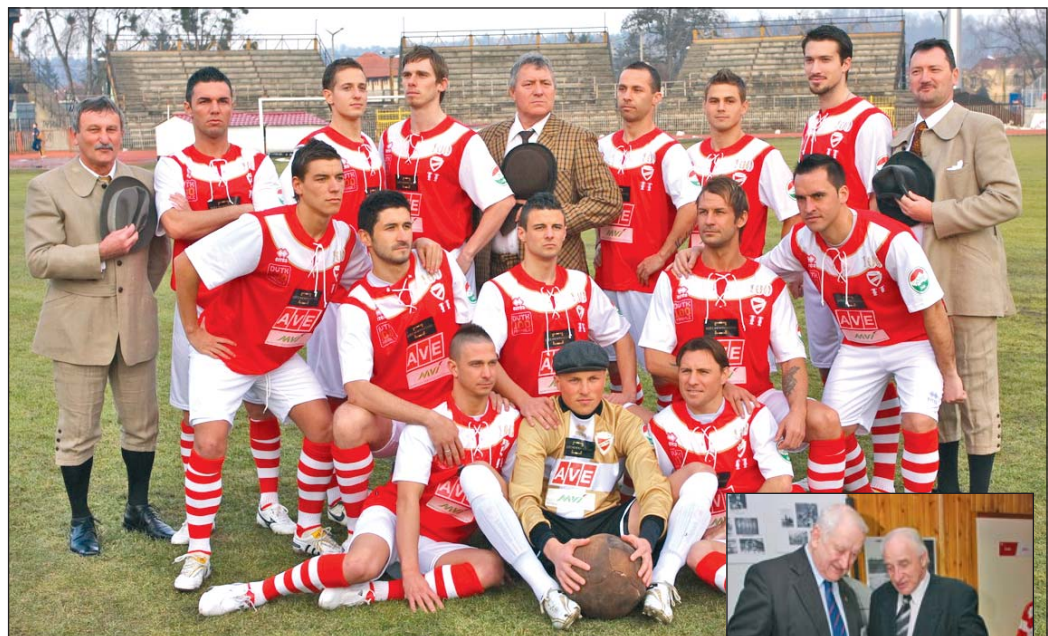
A DVTK csapatát az 1910-es éveket idéző mezben fotózták. Kis fotónkon: pénteken nyílt „A 100 Éves Diósgyőri Sport” című kiállítás.