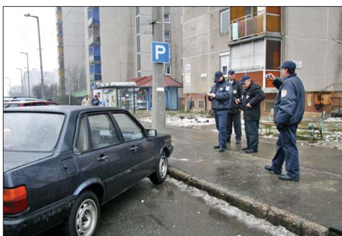
A társszervekkel együttműködve dolgoznak.

Meghatározza az egyes városrészek bűnügyi fertőzöttségét a veszélyeztetett csoportok, objektumok és területek jelenléte is. Az áldozattá válás szempontjából veszélyeztetett csoportot képeznek a gyermekek, a nők, az idősebb kor-