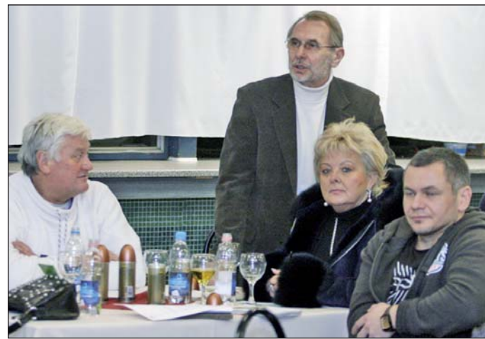
A vendéglátósokkal egyeztettek a Kocsonyafesztivál szervezői.

Idén is rendeznek izkocsonyaversenyt, melyen két kategóriában mérhetik össze tudásukat a kocsonyafésztetés mesterei. Kreatív kocsonya kategóriában nemcsak sertés-, hanem szárnyas-, vagy vadhúsból és halból is készíthetik a kocsonya-különlegességet. A második, tradicionális kategóriában hagyományos, sertéshúsból készített kocsonyával indulhat-