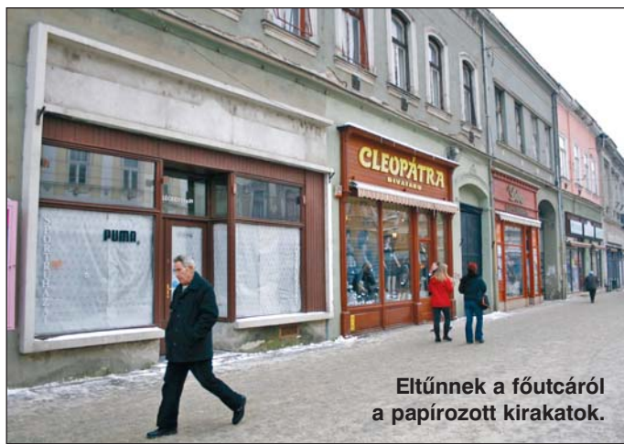
Eltűnnek a fűtcairól a papírozott kirakatok.

A Fűtcai Plaza Projekt célja az, hogy a belváros megújuljon, az üzletek, vendéglátóhelyek külső-belső megjelenése szebb legyen, az árak és szolgáltatások színvonala emelkedjen. Emellett bevezették az egy-séges, konzervens új pályázati és szerződés-kötési rendszert, illetve a