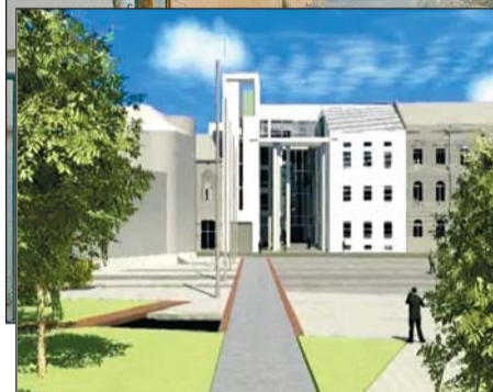
Csütörtökön bontották el a pengefalat és kezdődött meg a beruházás. Kis képünkön az épület látványterve.

körülmények között dolgoznak a tisztviselők. Az Integrált Városfejlesztési Stratégia keretében – a sikeres pályázatnak köszönhetően – most lehetőség nyílt egy valóban XXI. századi, teljességgel megújult miskolci Városháza kialakítására, megfelelő eszközökkel felruházott ügyfélbarát, szolgáltató hivatal létrehozására. Ez – a szakszerűség mellett – áttekinthető, könnyen igénybe vehető lesz, korszerű infrastruktúrát és körülményeket biztosít a tisztviselők és az ügyfelek részére, lényegesen