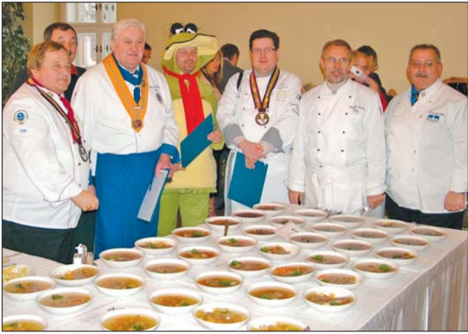
Idén már regionális az ízkocsonyaverseny. Fotónkon a tavalyi versenykocsonyák és a zsűri.

A gasztronómia mellett történelmi kalandozásokat is ígér programjában a tizedik, jubileumi Kocsonyafesztivál. A hagyományosan színvonalas kulturális programkínálat mellett a rendezvény igazi újdonsága a Fesztiválcsekk bevezetése lesz, amelynek birtokában vásárláskor kedvezményt kapnak a fesztivállátogatók.