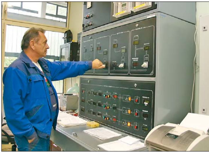
A monitoring-rendszer már majd egy éve vigyázza a miskolci ivóvizet.