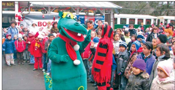
A Mikulás és a krampuszok mellett Süssü várta a gyerekeket idén a Mesebirodalomban.

Az idei utolsó Mikulásvonatra is ki lehetett volna tenni a „Megtelt” táblát. A gyerekeknek már az út is nagy élmény volt, hát még az állomáson tapasztaltak. Az utolsó vonatkozás előtt a szervezők köszönetet mondtak a támogatóknak és mindazoknak, akik segítettek a programsorozat létrejöttében.