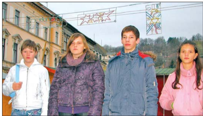
A pályázat díjazottjai és fölöttük a kifüggesztett fényfüzerek.

Gyermekrajzpályázatot hirdetett a Miskolci Városszépítő Egyesület Litwin József iparművész ötlete alapján – Jégvirág címmel. A legjobb rajzok díszkivilágításként kőszönnek vissza a belvárosban.