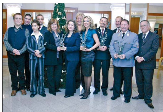
Az ideai díjazottak és az alapító.

Újra kiosztották a Miskolci Gyémánt díjakat. Hat szobrocskát adtak át – segélyszervezetek, előadóművészek, sikeres üzletemberek is vannak a kiválasztottak között – de az idén gyémántdíjas lett a Miskolci Tűzoltóság is.