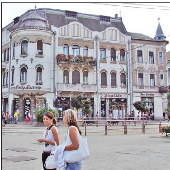
A saroképület felújított homlokzattal.

Az épület a szecesszióba hajló eklektika jellemző alkotása. A bérház hivalkodó nagypolgári homlokzattal, változó klinker- és vakolatmezőkkel, neoreneszánsz félbaluszteres, korlátbábas ablakkötényekkel, a reneszánszra emlékeztető szemöldökpárkányokkal, valamint látványos kovacsoltvas elemekkel büszkélkedik. Mai külső megjelenése, állaga jobbnak tűnik, mint ami felújításának korából következne.