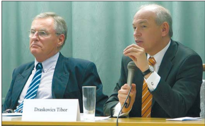
Balsai István (balról) volt és Draskovics Tibor jelenlegi igazságügyi miniszter a kerekasztal-beszélgetésen.