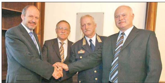
A két város közös sikere az elnyert pályázati támogatás.

A következő több mint két évben a katasztrófavédelem szakemberei az önkormányzatokkal