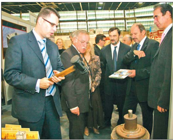
A megnyitó résztvevői nemcsak körüljárták az expót, de a diós-győri vár standján az érmeverést is kipróbálták.

A két város egyenrangú partnerként, kölcsönös előnyök és kötelezettségvállalás mellett működik együtt a projekt megvalósításában. Az ötéves program fő célja a gazdaságélénkítés mellett a kereskedelemfejlesztés és a piacmegtartás, illetve lehetőség szerinti bővítés. A miskolci rendezvényre a két országból több mint száz kiállító érkezett. A csütörtök délelőtti megnyitón dr. Takács István, a Külügyminisztérium gazdasági és tudománydiplomáciai fősztályának vezetője olvasta fel Göncz Kinga levelét, melyben a miniszter kiemelte: nagy hangsúlyt fektetnek a határon átnyúló együttműködésekre, hiszen a cél az egységes Európa, ahol szabadon