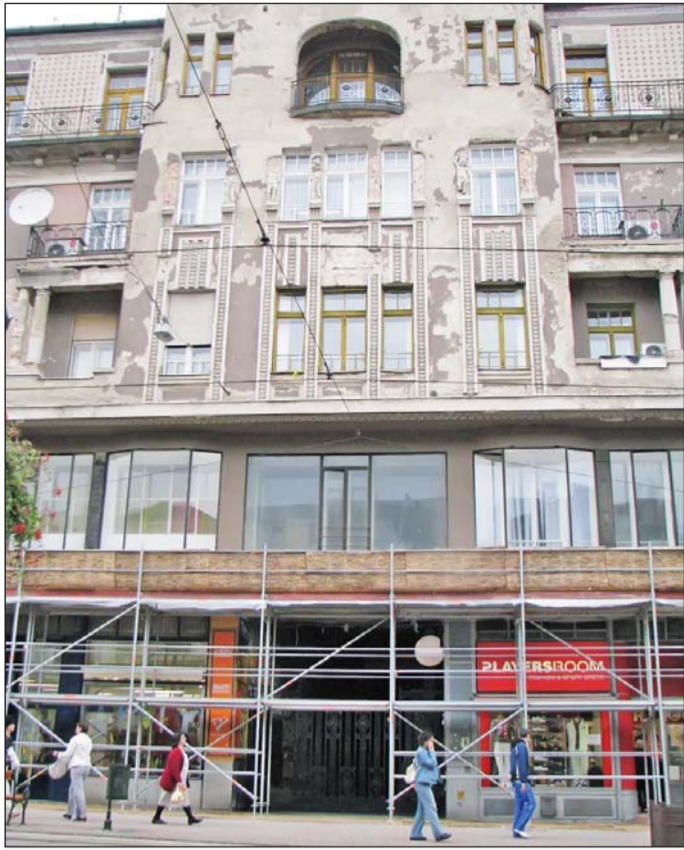
A Széchenyi u. 19. szám (az úgynevezett Weidlich-ház) vakolatdíszének eltávolítását például be kellett jelenteni a hivatalhoz.

– Az életveszély elhárítását célzó munkálatok viszont nem engedély-