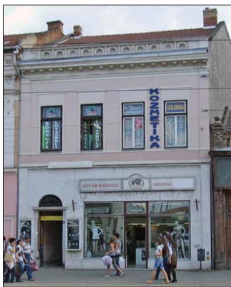
Az épület felújított homlokzata 2008-ban.