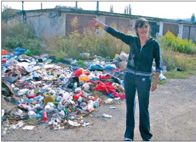
A Számozott utcák végéről már eltűnt a szemét.

Közhangként hathat a jó tanács, hogy ne általánosítsunk, de ez a legokosabb, amit az élményből leszűr-