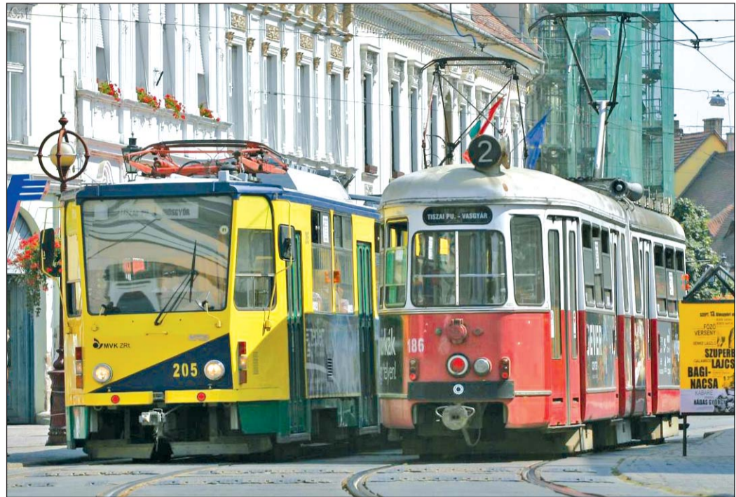
Hamarosan új villamosok szállítják majd a miskolciakat a megújult sínpályán.

Mindezzel párhuzamosan folyamatosan halad Miskolcon a szakmai előkészítő munka is. A Miskolc Városi Közlekedési (MVK) Zrt.-n belül létrejött a Projekt Igazgatóság, amely az operatív feladatok vég-