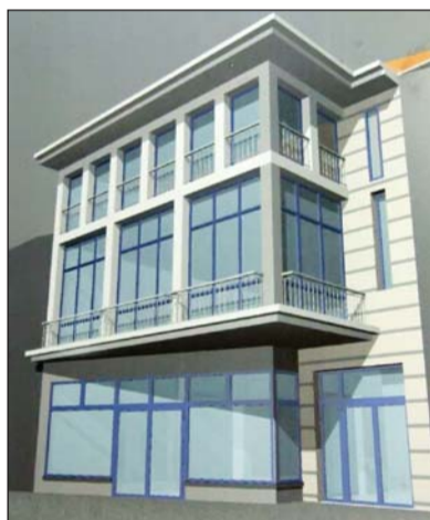
Egy elképzelés a számos homlokzati terv közül.

A főutcai homlokzat emeleti része megőrizte eredeti stukkó- és vakolatdíszzeit. A földszint bal (keleti) oldalán kialakított dufart megőrizte szépen megmunkált, s